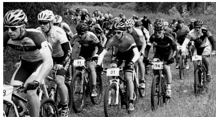
Dešimtą kartą Anykščiuose rengiamas dviračių maratonas pasižymėjo didžiuliu dalyvių skaičiumi vidutinio sudėtingumo trasa bei kultūrine programa.