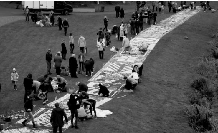
Aukštaitišką juostą iš obuolių dėliojo 21 rajono kaimo bendruomenė ir nevyriausybinė organizacija.